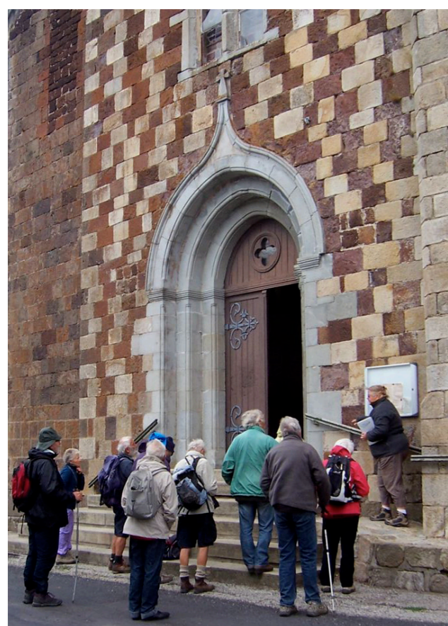
Sortie étude des matériaux de l'église de Boré