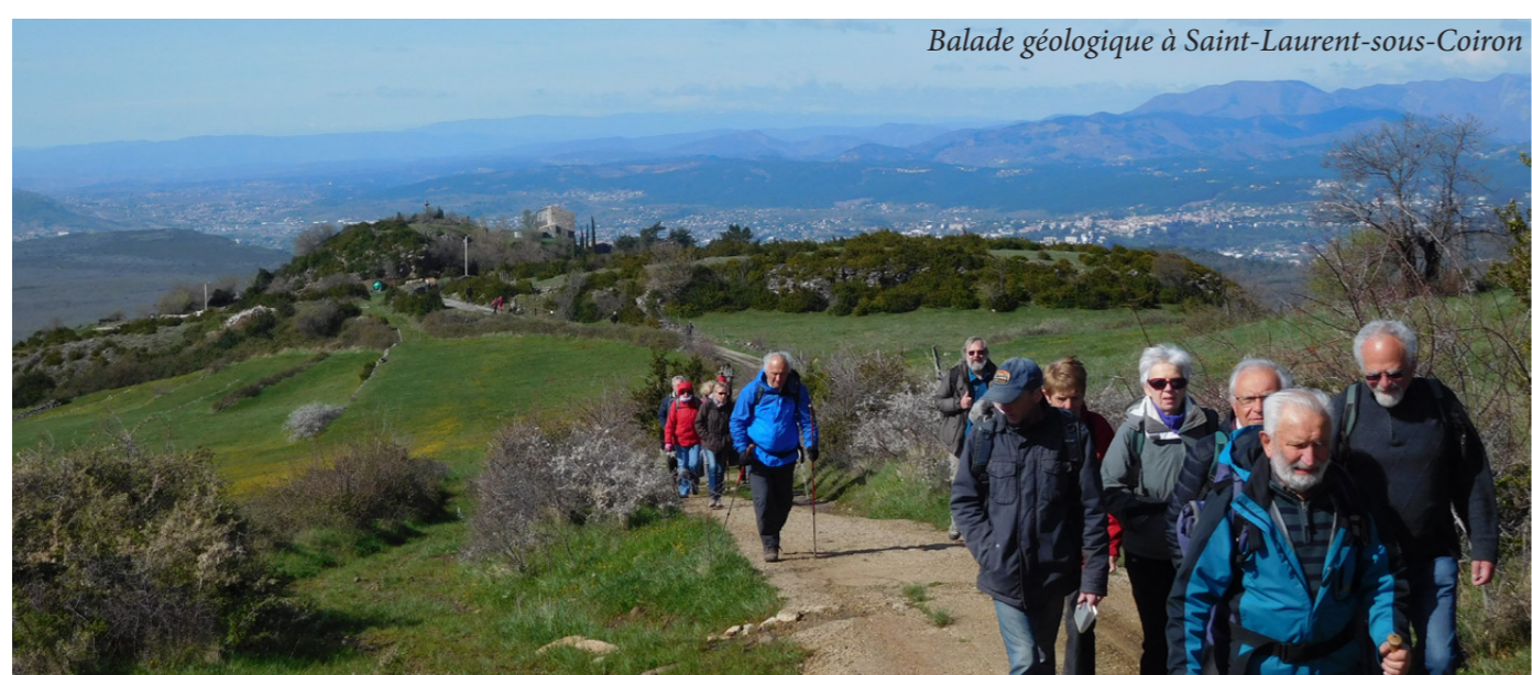
Balade géologique à Saint-Laurent-sous-Coiron

Elle possède un centre de documentation et met à la disposition des adhérents des cartes géologiques, des publications d'associations géologiques régionales, des revues scientifiques et des milliers d'ouvrages de géologie.