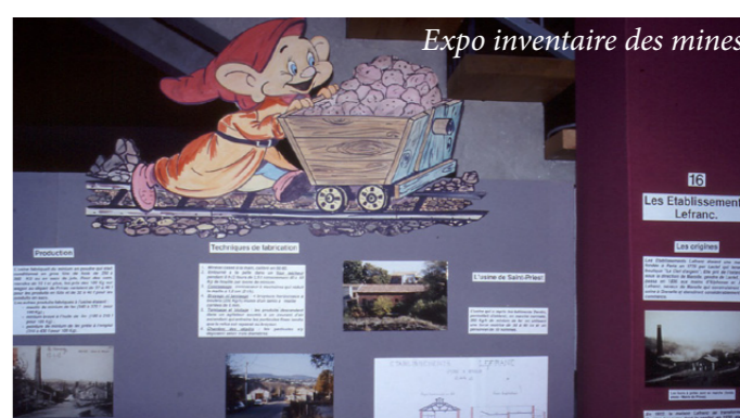
Expo inventaire des mines

Des fouilles ont permis des découvertes majeures :