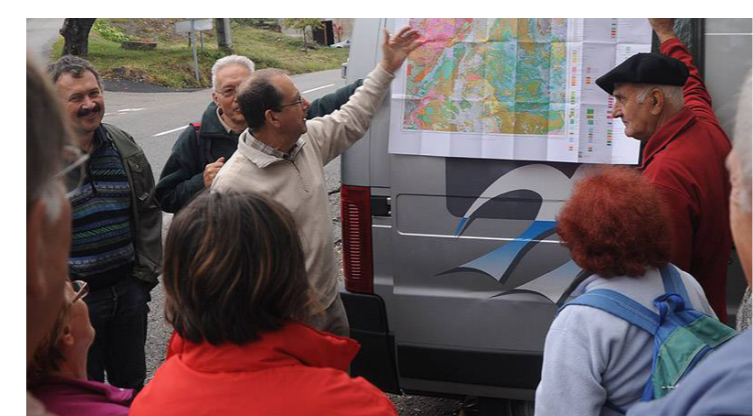
Sortie du carbonifère au Trias