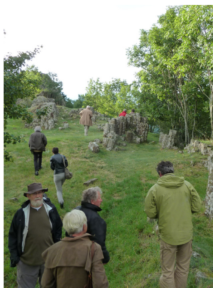
Accueil des experts de l'UNESCO pour l'obtention du label geopark au rocher de Brion