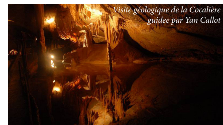
Visite géologique de la Cocalière guidée par Yan Callot