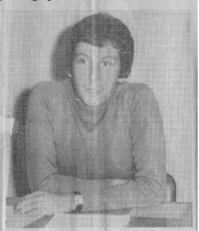
Assemblée Générale constitutive de la SGA

Ayant pour objectif principal la création d'un musée de géologie régional elle sera un partenariat privilégié du Musée de la Terre Ardéchoise (1986-2002).