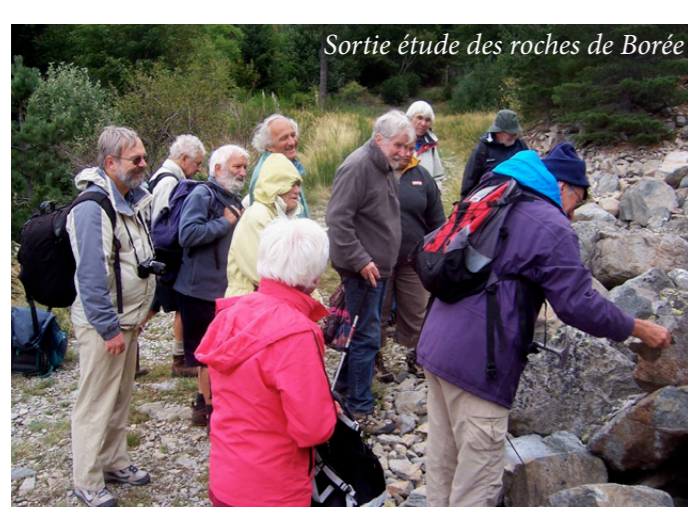
Sortie étude des roches de Boré

La SGA propose depuis 40 ans : des excursions, des stages, des visites de sites, des conférences, avec comme objectif de faire découvrir le riche patrimoine géologique de notre département : des reliefs ruiniformes de Paiolive au sud au socle cristallin en passant par les volcans, et les gorges taillées dans le calcaire. Par ailleurs, la Société organise un festival de l'aventure scientifique qui a lieu tous les 5 ans. Cette année il coïncide avec le 40 e anniversaire ; une occasion de plus de recevoir des universitaires.