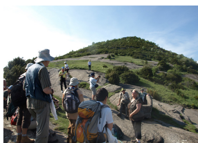
LAVE AG : 150 géologues visitent le Coiron en trois groupes