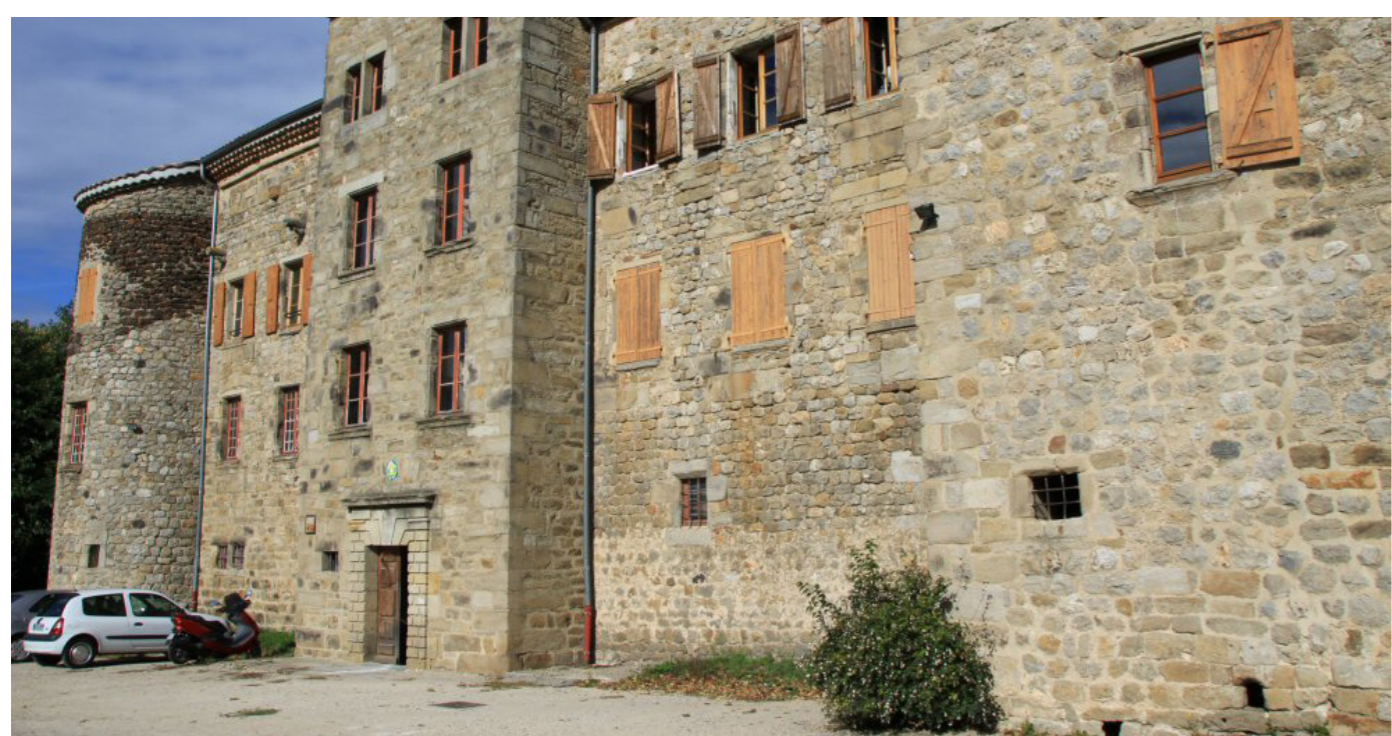
Les membres de la SGA devant le château de Castrevielle

Après de nombreuses pérégrinations, la Société est accueillie par la municipalité de Jaujac. Aujourd'hui elle a son siège au château de Castrevielle.