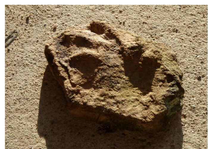
Participation à l'étude des empreintes de reptiles avec l'université de Dijon

- Enfin, de 2012 et 2014, la Société a été sollicitée et très impliquée dans la réalisation du dossier de candidature au label UNESCO « geopark » pour le compte du Parc naturel régional des Monts d'Ardèche. Un inventaire d'une centaine de géosites (sites géologiques remarquables du PNR) a été réalisé à cette occasion. La qualité de ce travail a permis l'obtention du label UNESCO par le PNR en septembre 2014. Aujourd'hui, la société est largement représentée au sein du comité scientifique du geopark. Une convention permet aujourd'hui de nombreuses opérations de partenariat.