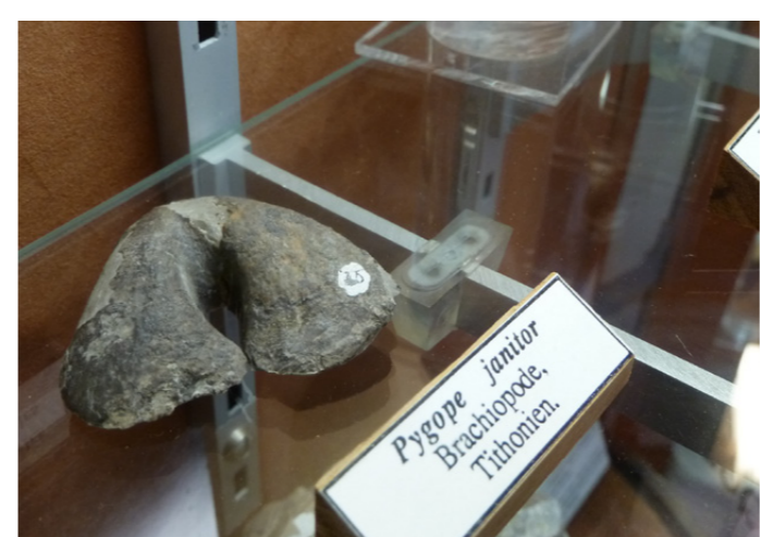
Pygope janitor, la SGA participe à l'étude du stratotype et à la mise en valeur du musée des Vans