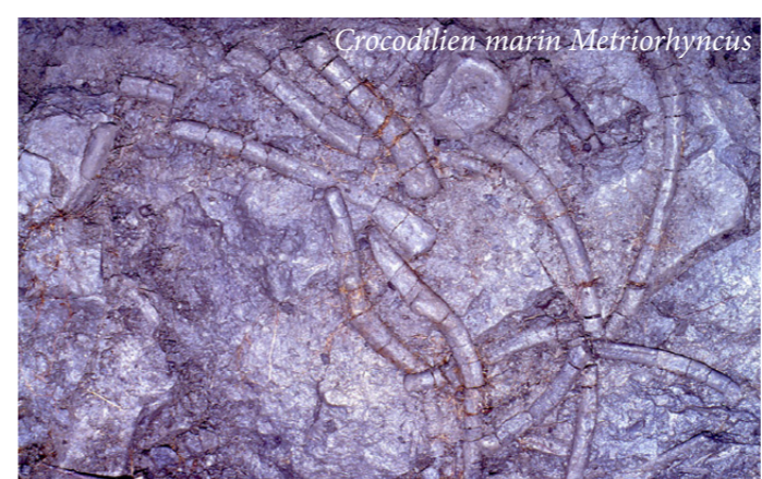
Crocodilien marin Metriorhynchus

Des fouilles ont permis des découvertes majeures :