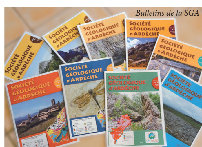
Bulletins de la SGA

La SGA édite depuis 1977 un bulletin riche en articles variés. Mensuel en 1977, trimestriel en 1998, il est aujourd'hui annuel et en couleur.